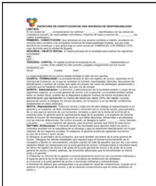
Escritura de Constitución de la empresa.