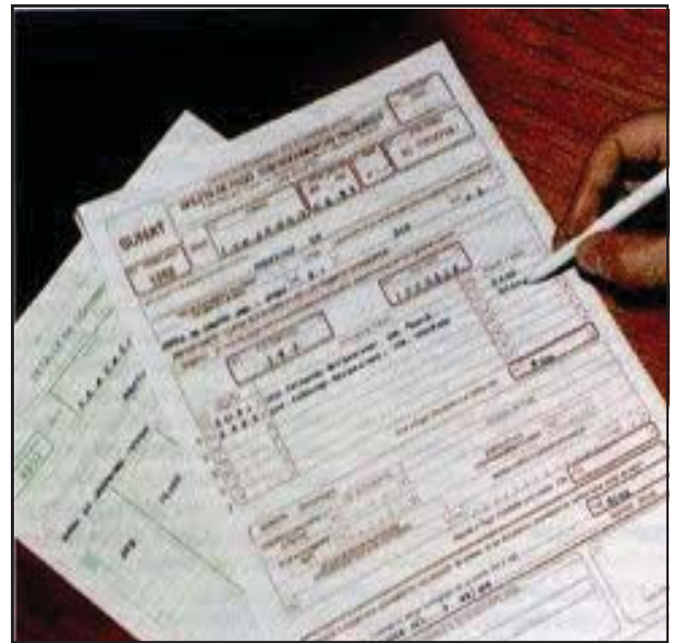
Formulario del Registro único de contribuyente (RUC).